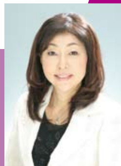
夫婦問題研究者 岡野あつこ氏

NHKドラマ 『コンカツ、リカツ』監修、 『エチカの鏡』出演 夫婦問題研究者 岡野あつこ氏の 講義もあります。